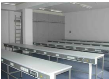
Seminarraum mit elektroversorgten Arbeitstischen und Schrankwand mit Aufsätzen und Leiterzarge