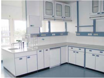
Laborarbeitsstisch mit Energiezellen und Hängeschränken, verglaste Flügeltüren