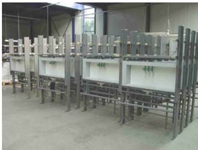
In der Fertigung