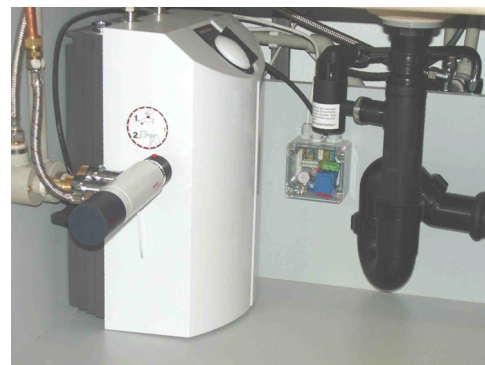
Druckfester Warmwasserbereiter mit Sicherheitsarmatur im Installationsunterbau