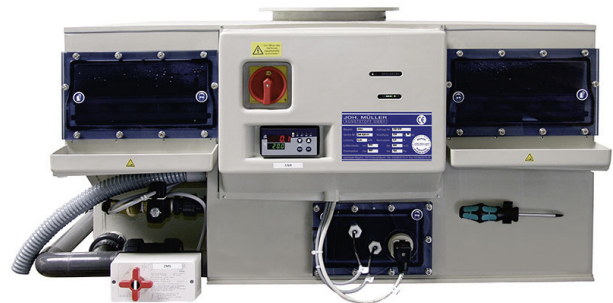
Abluftwäscher für Laborabzug