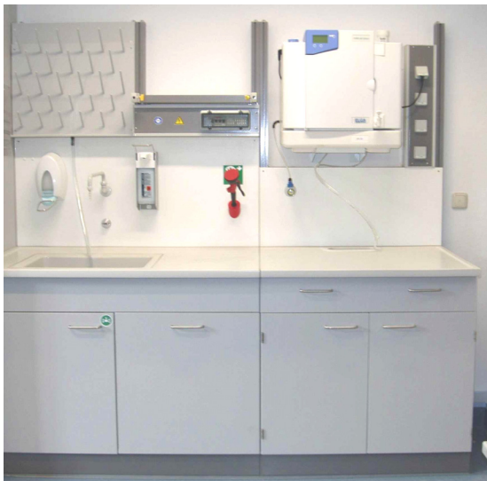
Spülarbeitsplatz mit berührungsloser Armatur, zellenbefestigter Augendusche und Reinstwasseranlage