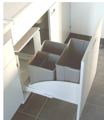
4fach-Abfalltrennsystem auf Frontauszug