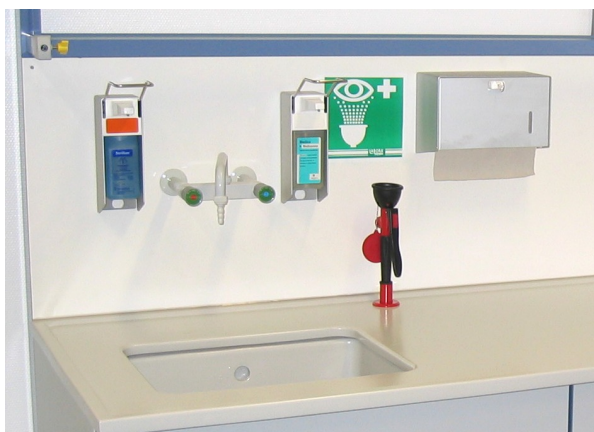
Spüle mit Hygiene- und Sicherheitszubehör: Seifen-, Desinfektionsmittel-, Handtuchspender; Augendusche tischbefestigt