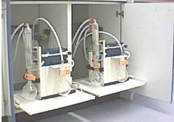
Vakuumpumpen installiert auf Rollauszügen im Unterbau