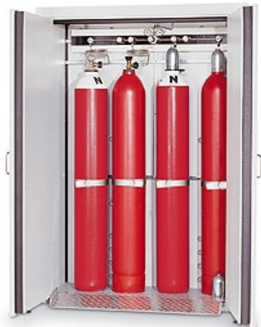
Druckgasflaschenschrank nach DIN 12925 Teil 2