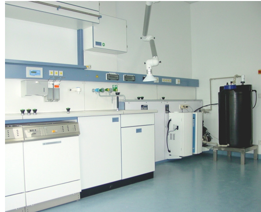
Nassarbeitsplatz mit Reinigungs- und Desinfektionsautomat, zentraler Reinstwasseranlage, Punktabsaugung