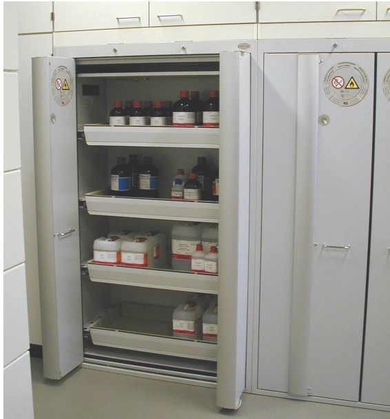
Gefahrstofflagerschrank nach EN 14470