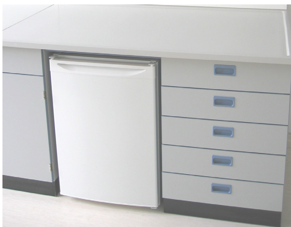
Arbeitsstisch mit Unterbau-Kühlschrank