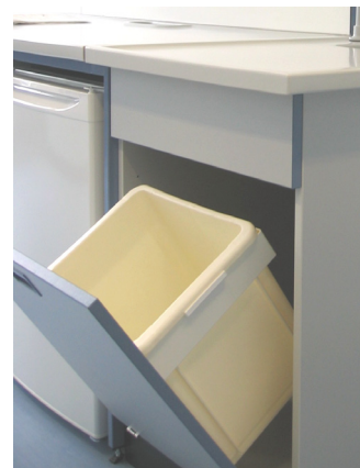
Abfallbehälter befestigt an Kipptür