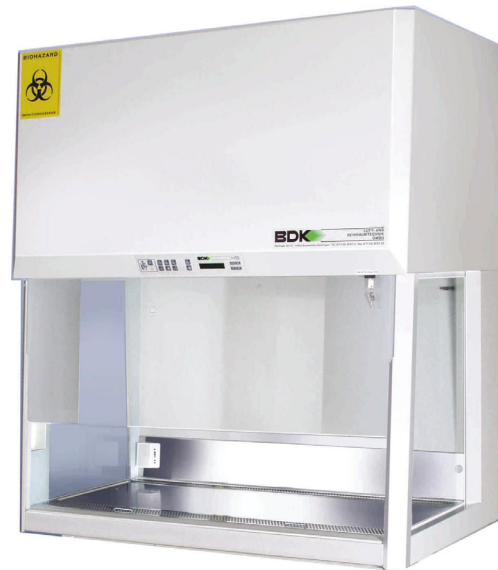
Sicherheitswerkbank nach EN 12469